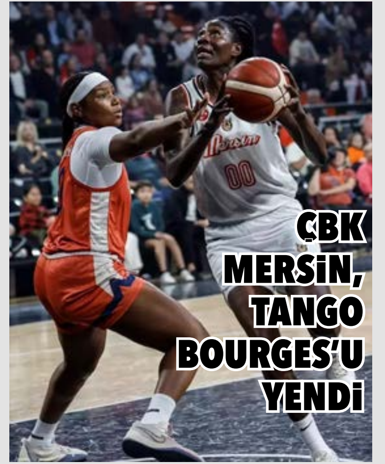
FIBA Kadınlar Avrupa Ligi B Grubu 4. hafta maçında ÇBK Mersin, Fransa temsilcisi Tango Bourges Basket'i 80-76'lık skorla mağlup etti. Maçta önemli performanslar sergileyen oyuncularla galibiyete ulaştı.